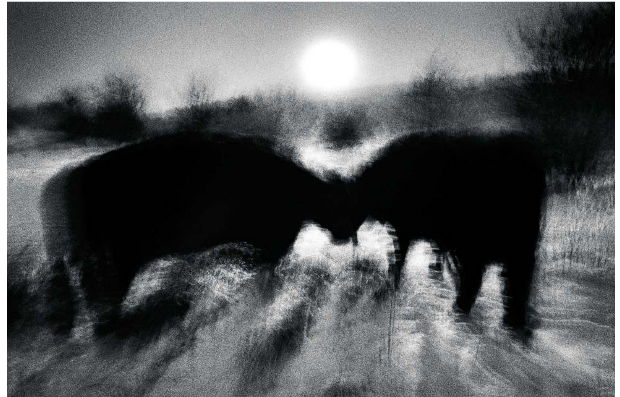
Van elkaar bevechtende runderen in de mist naar de restanten van een praalwagen bij carnaval: Lambrichts ontmoet in zijn dorp Oeverlangen steeds meer tekenen van voorbij beschaving.

ge contouren van mensen zelf, voortvallen in het kale, besneeuwde winterland, kondigen een verandering die op til is onvermijdelijk aan. Het imaginaire Oeverlangen, waar opbouw en afbraak, geboorte en dood, bloei en verval in tijd en plek samenvallen, is een feit. Kadavers OnheilsPELLende taferelen – een vervallen, vervallen woonwagen, vergeten wasgoed aan een lijn, de een lange schaduw werpende vogelverschrikker in een maisveld, kadavers van grote gefileerde vissen aan de Maasoever – bevestigen dat het hier niet pluis is. En wild kolkt het water steeds voorbij. Steeds meer tekenen van voorbij beschaving ontmoet Lambrichts. De