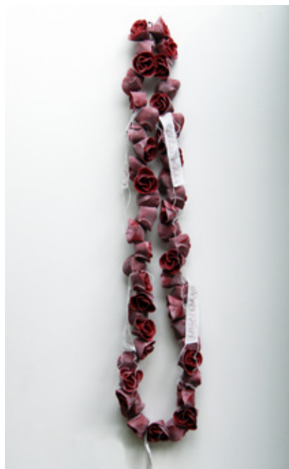
'AL JE GEDACHTEN' GIETHARS, BORDUURWERK, STAALDRAAD, 2011