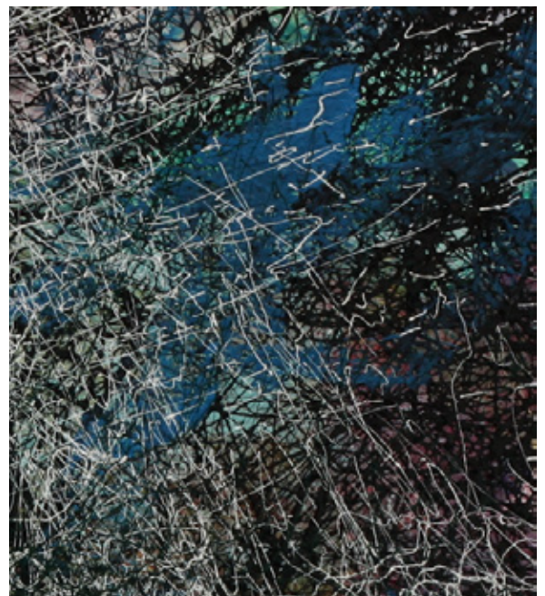
REINOUD VAN VUGHT 'GEEN TITEL' 50 X 60 CM, OLIE-, ALKYD- EN LAKVERF OP LINNEN, 2011