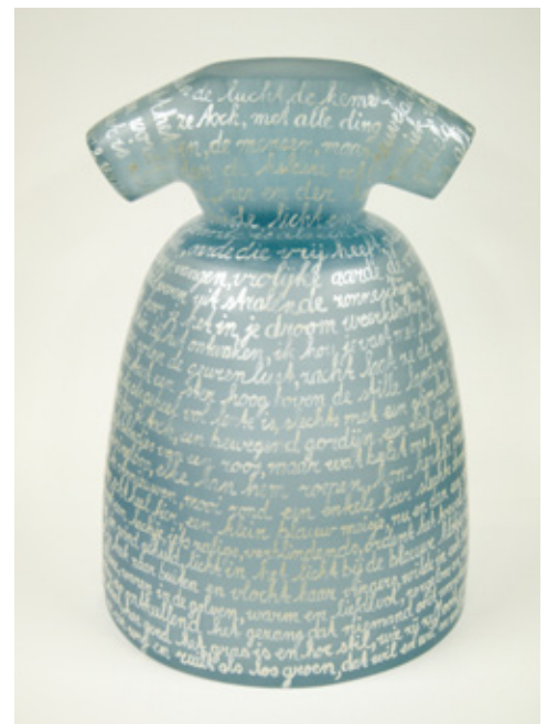
'KLEIN BLAUW MEISJE' 56 X 40 X 40 CM, GIETHARS, 2011