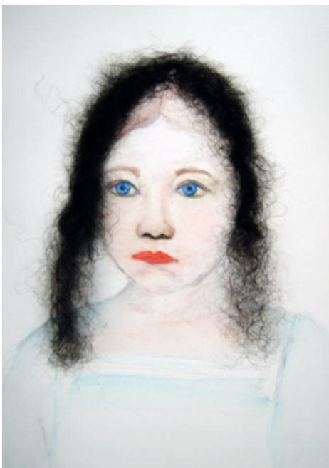
YVONNE MOSTARD 'KINDERPORTRET' 20 X 30 CM, AQUAREL, HAAR, 2011

Er is zo veel te zien en te lezen in het werk van Mostard, zo veel dat uitnodigt tot het maken van een reis en dat haar werk verbindt met schoonheid, weelde en zinnelust, dat al haar werk aantekeningen door de tijd heen lijken te zijn, reikend naar het wonderland.